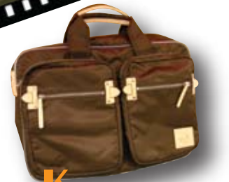
Kaulua -Three Days-