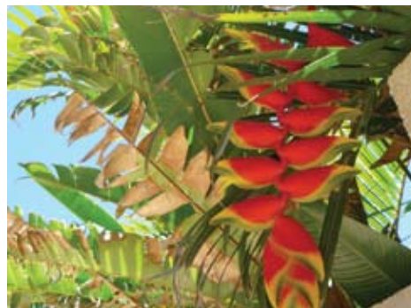
Misatoさん 南国大好き! ハワイの太陽とビーチ、風に吹かれてアロハスピリットを日々感じながら毎日を暮らしている21歳★