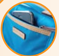
イタリアの革使用