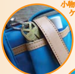
小物が入るポケット付き