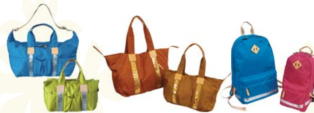
マリアシリーズに新作登場！ふくらデザインショルダーバッグ